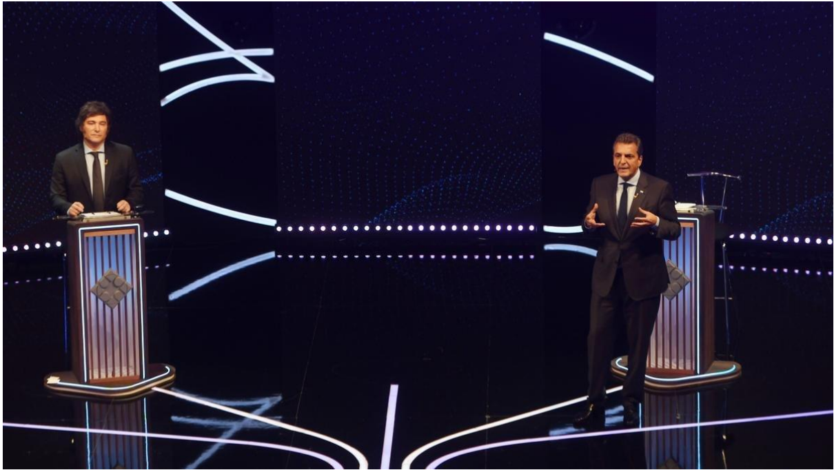
Javier Milei y Sergio Massa durante uno de los debates televisados.

No obstante, el Senado queda en manos de la oposición, ¿cómo podría afectar tal hecho la gestión presidencial? ¿Se vislumbra algún tipo de colaboración en aras de solucionar la profunda crisis que atraviesa la nación?